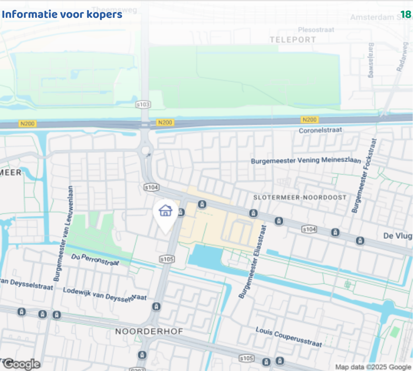
Woningbrochure: Jan de Louterstraat 18, Amsterdam