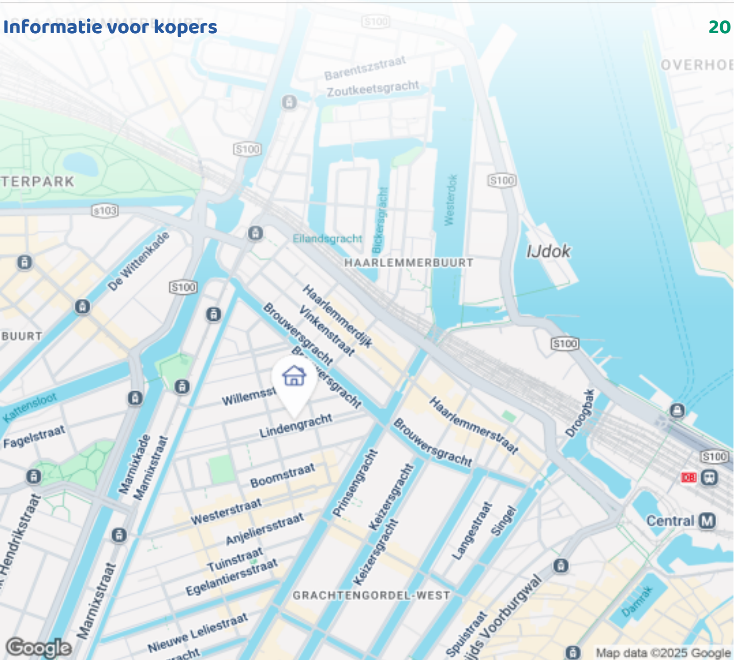
Woningbrochure: Lindengracht 128 3A, Amsterdam