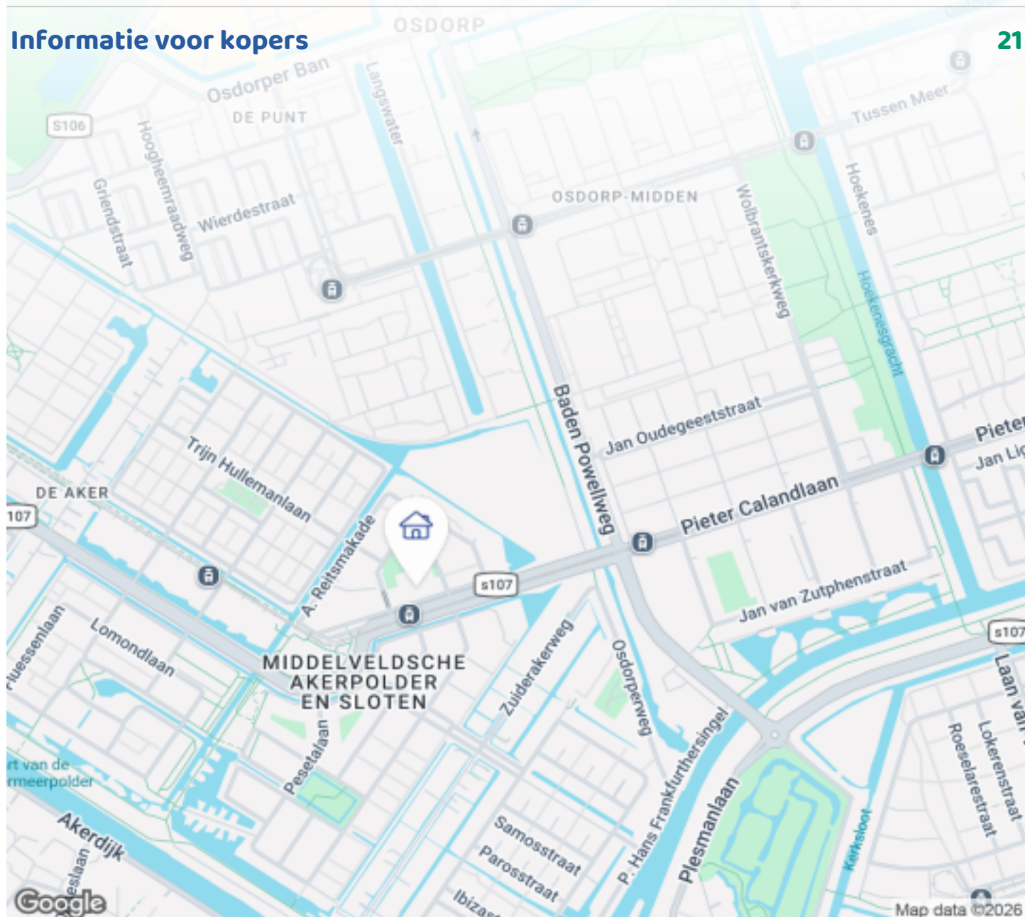
Woningbrochure: Pieter Calandlaan 586, Amsterdam