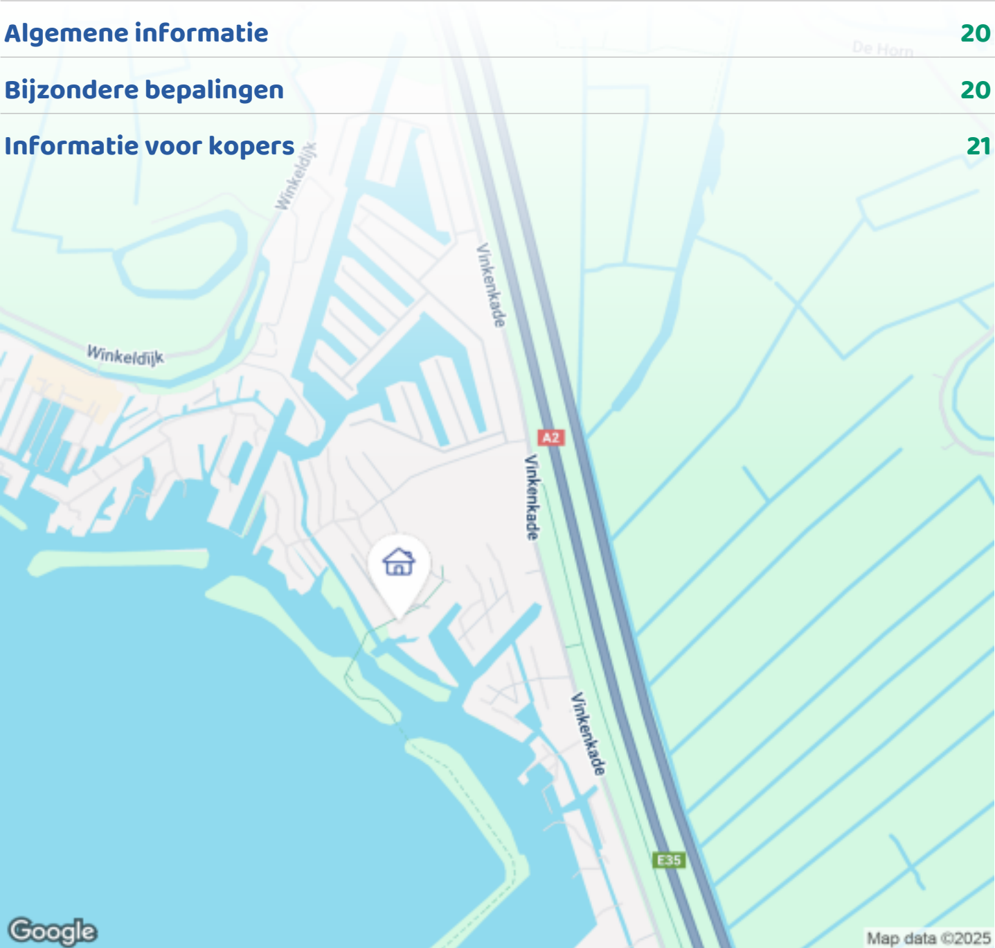
Woningbrochure: Molenkade 20 R 5, Vinkeveen