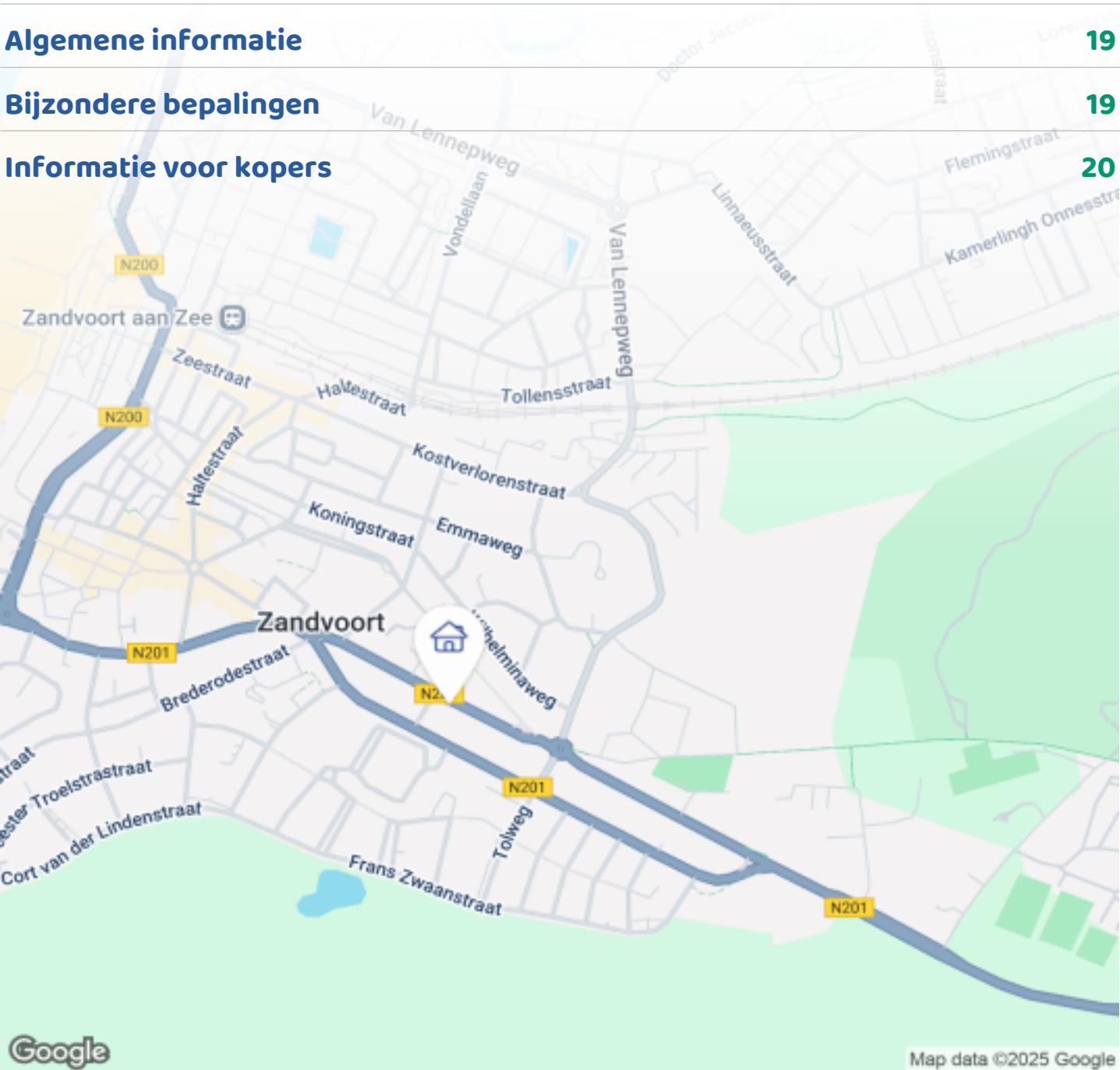
Woningbrochure: Haarlemmerstraat 52, Zandvoort