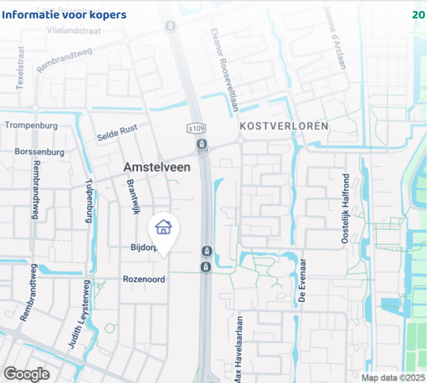
Woningbrochure: Van Heuven Goedhartlaan 426, Amstelveen